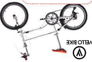
FaltRad VELLO aus Wien