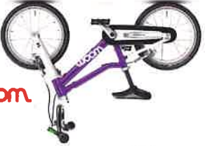
woom Das vielfach ausgezeichnete Kinderfahrrad