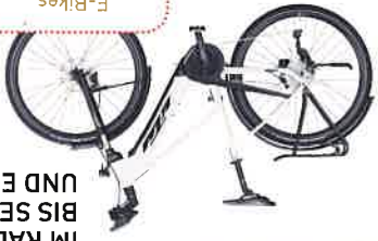
Klimaaktiv E-Bikes KTM Macina Sport Made in Austria

IM RADEL-LOTTO GIBT ES VON MAI BIS SEPTEMBER VIELE FAHRÄDER UND E-BIKES ZU GEWINNEN!