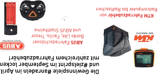
Die Gewinnspiele #nadeln im April und #zielsprint im September locken mit zahlreichen Fahrradzubehör!

Für die aktivsten Gemeinden, Vereine und Schulen gibt es Sonderpreise!