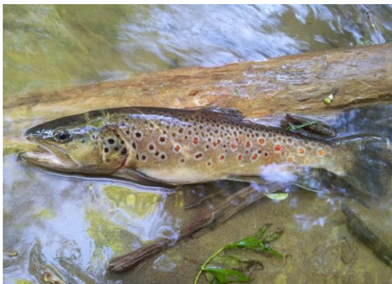
Fang einer schön „gezeichneten“ Bachforelle