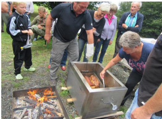
Mitgliedertreffen mit „Kistenfleichessen“

Gezielte jährliche Besatzmaßnahmen von Bachforellen und Jungfischen zählen neben den gesellschaftlichen und gemeinnützigen Aktivitäten zu den Fixpunkten im Vereinsjahr. Gemeinsame Angeltage im Revier mit Ausklang am Grillplatz, die jährliche Flurreinigungsaktion oder das bereits traditionelle Vergleichsfischen mit der Teichgemeinschaft beleben das Vereinsgeschehen.