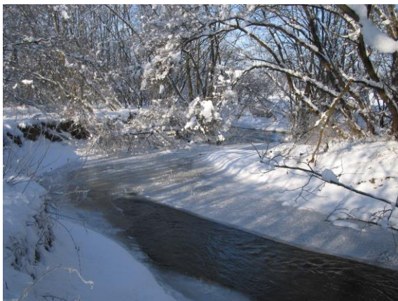
Lafnitz im Winter

Das Pachtrevier des Fischereivereins, die Lafnitz und der Stögersbach, liegen inmitten des Naturschutzgebietes der Lafnitz/Stögersbach-Auen. Dieser Bereich ist bekannt für seinen naturbelassenen und stark mäandernden Flusslauf, wie auch für die dort einzigartige Tier- und Pflanzenwelt.