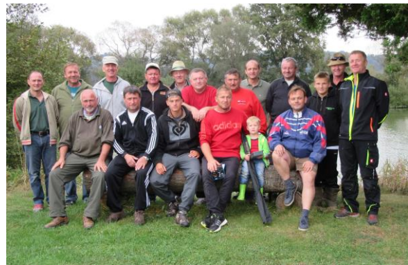
Vergleichsfischen mit der Teichgemeinschaft