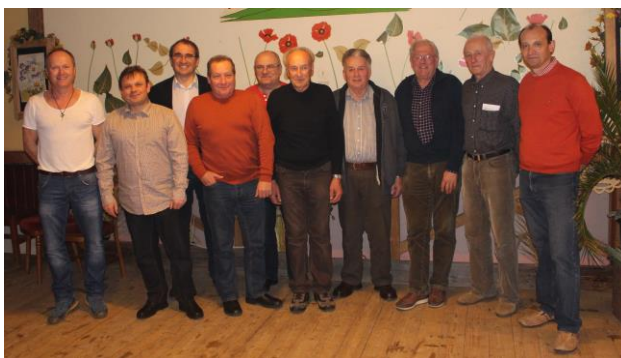
Vereinsvorstand Fischereiverein Wolfau