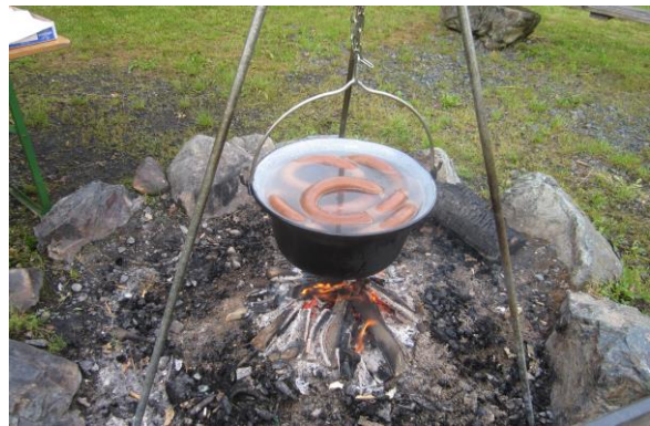
Angeltag mit Jause „Kesseldürrer“ am Grillplatz