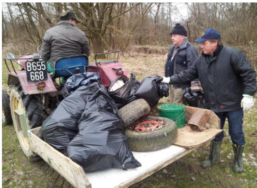
Flurreinigung an der Lafnitz/Stögersbach